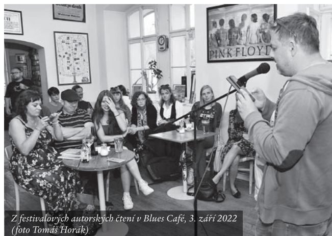
Z festivalových autorských čtení v Blues Café, 3. září 2022