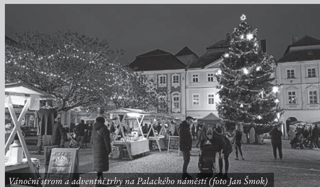
Vánoční strom a adventní trhy na Palackého náměstí