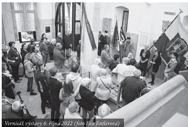
Vernisáž výstavy 6. října 2022