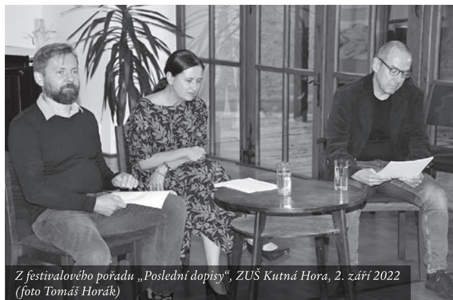
Z festivalového pořadu „Poslední dopisy“, ZUŠ Kutná Hora, 2. září 2022