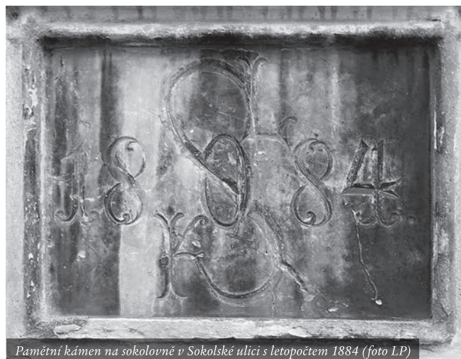
Pamětní kámen na sokolovně v Sokolské ulici s letopočtem 1884

Letošní výročí se snažíme využít k větší propagaci sokolského hnutí, s kterým se většina z nás ztotožňuje. Pro myšlenku zdravého pohybu se nám daří získat zejména rodiče a jejich děti. Kromě cvičení se pravidelně setkávají i na takových akcích, jako je Jarní výlet sokolůků , Dětský den na Sokoláku nebo Sokol spolu v pohybu . Vloni jsme se připojili k institucím, které pořádají příměstské tábory. Máme radost, že v posledních letech přibývá cvičících skupin, a dokonce se nám podařilo z řad maminek získat i nové cvičitelky. Na vydání výročního almanachu jsme získali grant od ČOS a ve spolupráci s Čes-