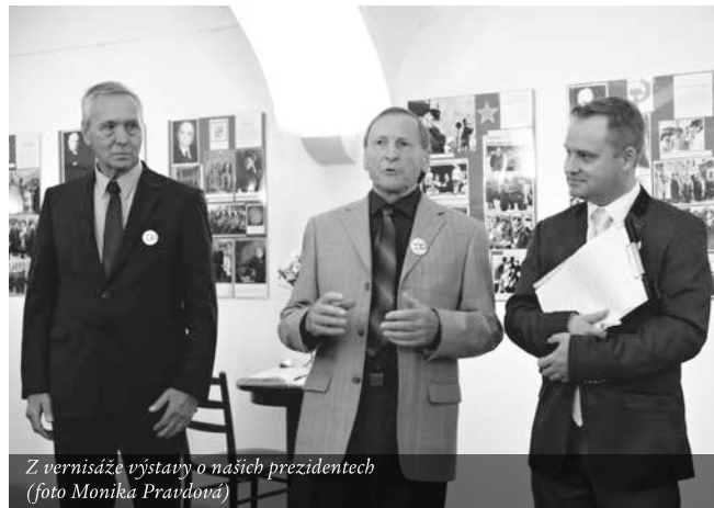
Z vernisáže výstavy o našich prezidentech