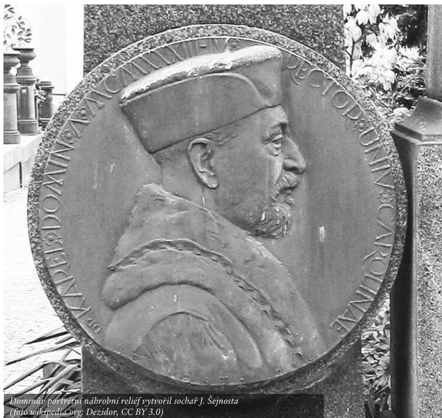
Domínův portrétní nábrobní reliéf vytvořil sochař J. Šejnosta