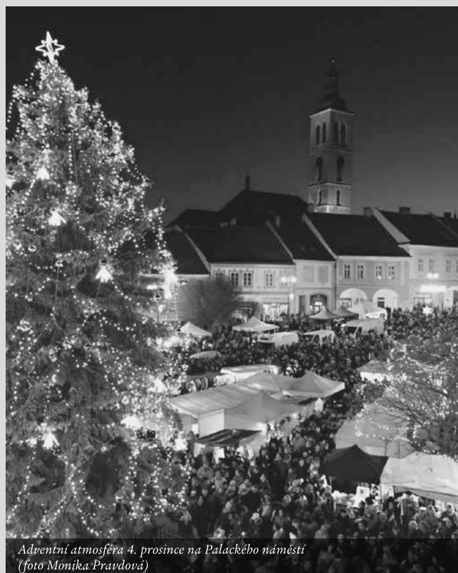
Adventní atmosféra 4. prosince na Palackého náměstí