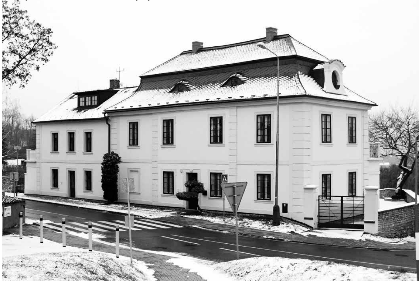
Současný stav Dominova rodného domu v České ulici čp. 2

Ruku v ruce s jeho odborným působením šly také organizační aktivity. Roku 1912 inicioval vznik České botanické společnosti (předseda v letech 1914–1945), byl zakladatel a předsedou Geobotanické karpatské unie, založil Ústřední komisi pro sběr