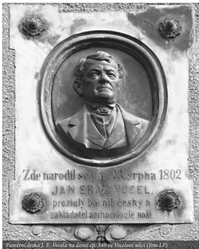
Pamětní deska J. E. Vocela na domě čp. 349 ve Vocelově ulici

V roce 1876 se Kutná Hora rozhodla odhalit pamětní desku na rodném domě prof. Jana Erazima Vocela (1802–1871), zakladatele české archeologie, básníka, dramatika a národního buditele. Ten se podle zápisu v křestní matrice narodil 23. srpna 1802 v domě čp. 345. Protože však v Kutné Hoře došlo v letech 1803, 1829 a 1845 opakovaně k přečíslování domů, měl mít Vocelův rodný dům nové čp. 349. Nacházel se v Jatecké ulici, kterou se město současně s odhalením desky rozhodlo přejmenovat na ulici Vocelovu.